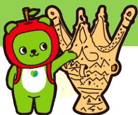
長野県PRキャラクター「アルクマ」 ©長野県アルクマ 16-0119

こどもの日を歴史館ですごしてみませんか。 楽しい体験イベントを用意してお待ちしています。