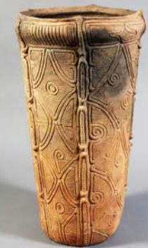
藤内遺跡出土品 重要文化財 (富士見町 井戸尻考古館蔵)