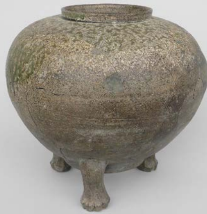
須恵器三足短頸壺 (中手田遺跡、豊丘村教育委員会蔵)

ホームページ http://www.npmh.net/ Eメール rekishikan@pref.nagano.lg.jp