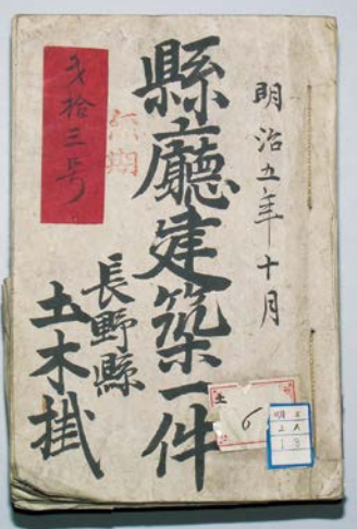
明治5年10月 県庁建築一件 長野県土木掛(当館蔵、長野県宝)