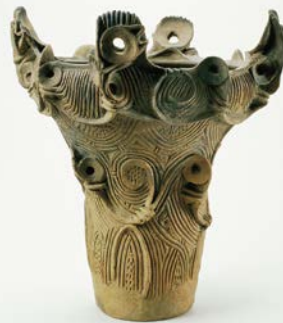
川原田遺跡出土品 重要文化財 (御代田町 浅間縄文ミュージアム蔵)